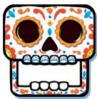
Totentopf – Tafel

Beispiel: Bei einer Partie zu fünf werden die Zahlenkarten 1 bis 5 benötigt.